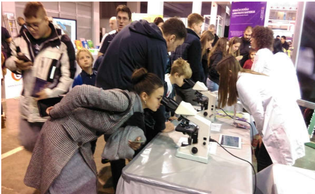
“Коначни окршај: Људи против бактерија“