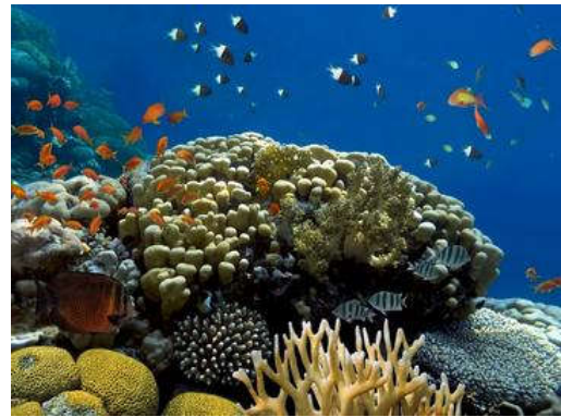
„Мали корак за велико плаветнило“