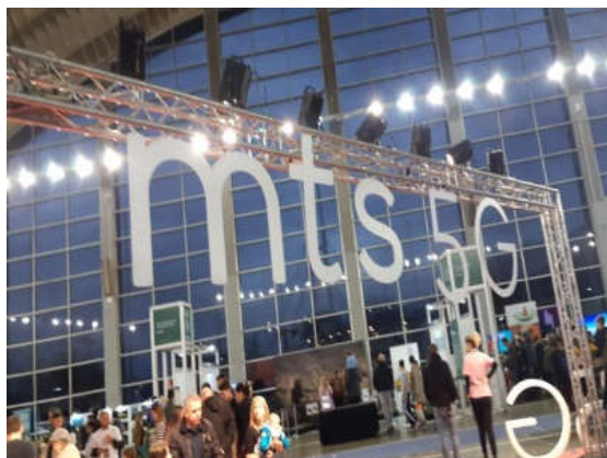
МТС- Будућност, 5Г мрежа