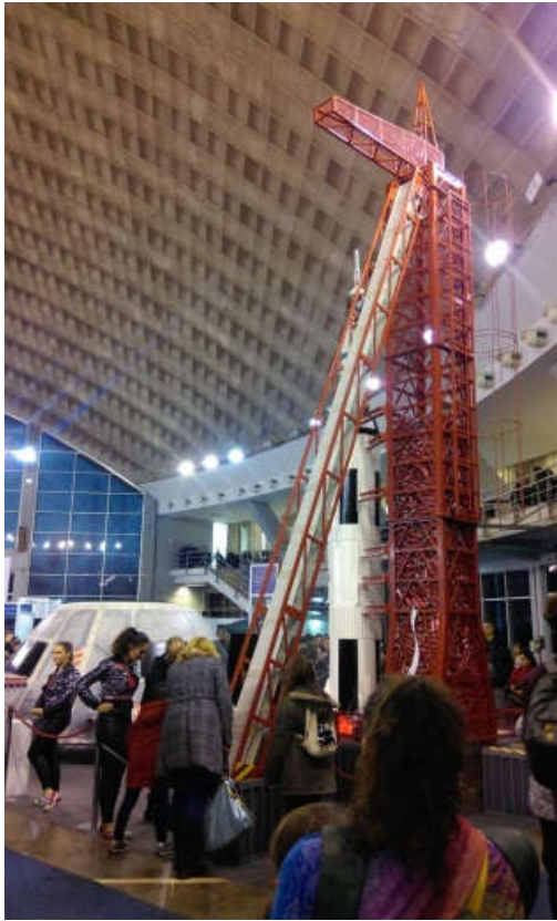
“Рециклирај паметно, рециклирај савесно“