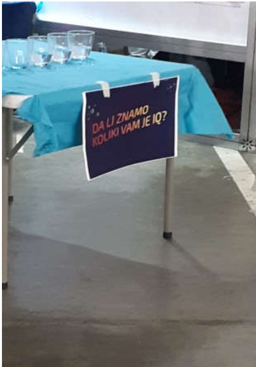
„ Ослободи ум“