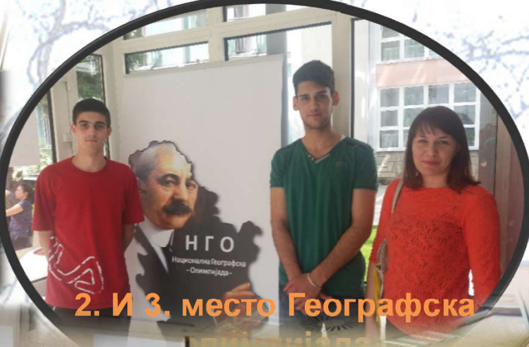
2. и 3. место Географска олимпијада