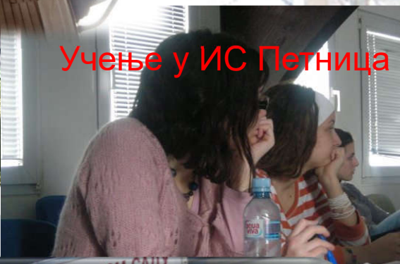
Учење у ИС Петница