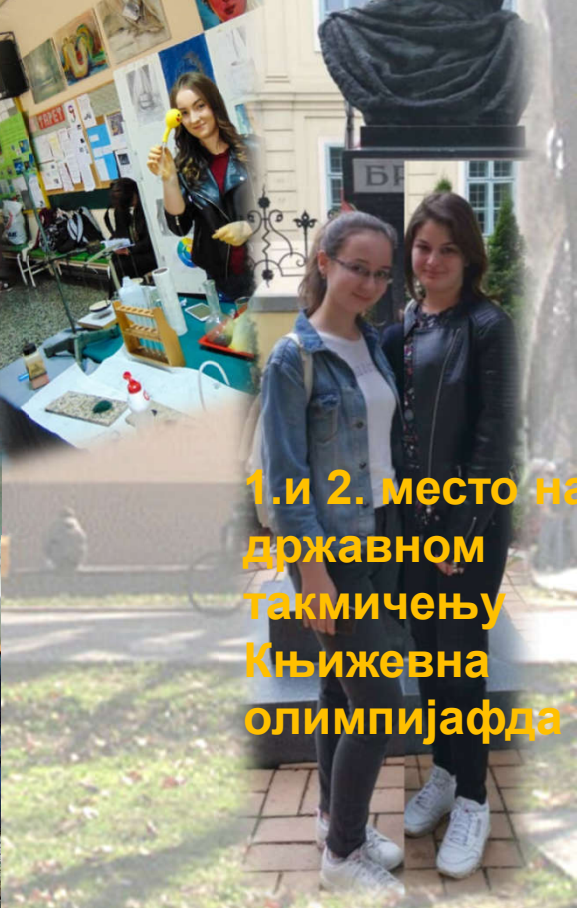
1. и 2. место на државном такмичењу Књижевна олимпијада