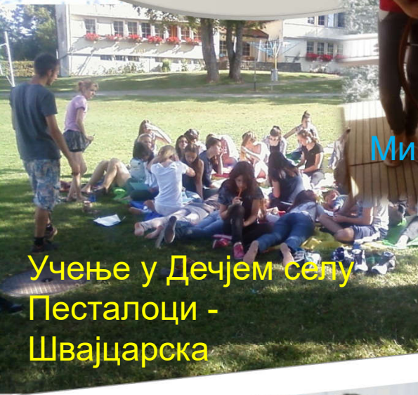
Учење у Дечјем селу Песталоци - Швајцарска