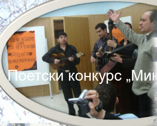
Поетски конкурс „Мик