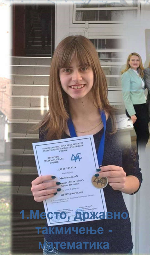
1. Место, државно такмичење - математика